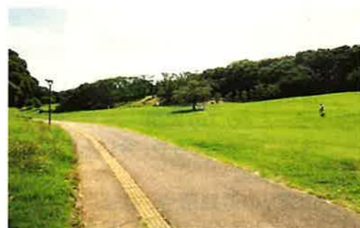
現在の根岸森林公園(令和4年7月撮影)