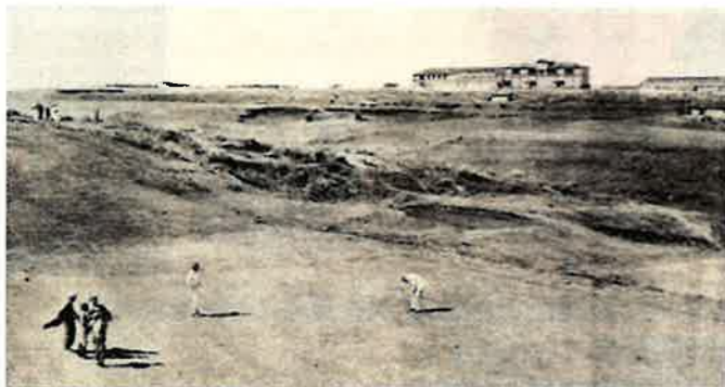
大正5年、競馬場内のゴルフ場(「ザ・バンカー」より)

戦後は競馬場全体が米軍に接收されると、芝生が再整備されて米軍専用のゴルフ場として再び使われ始め、昭和44年の返還まで使われていたことは記憶に残っている人も多いでしょう。